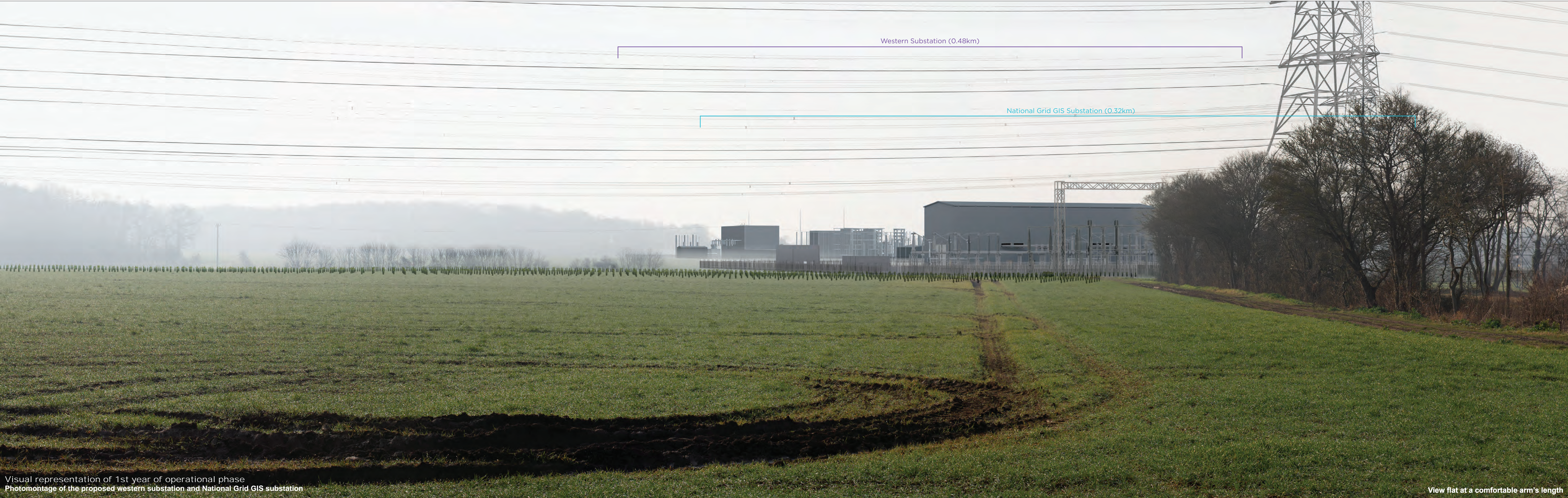
Visual representation of 1st year of operational phase Photomontage of the proposed western substation and National Grid GIS substation