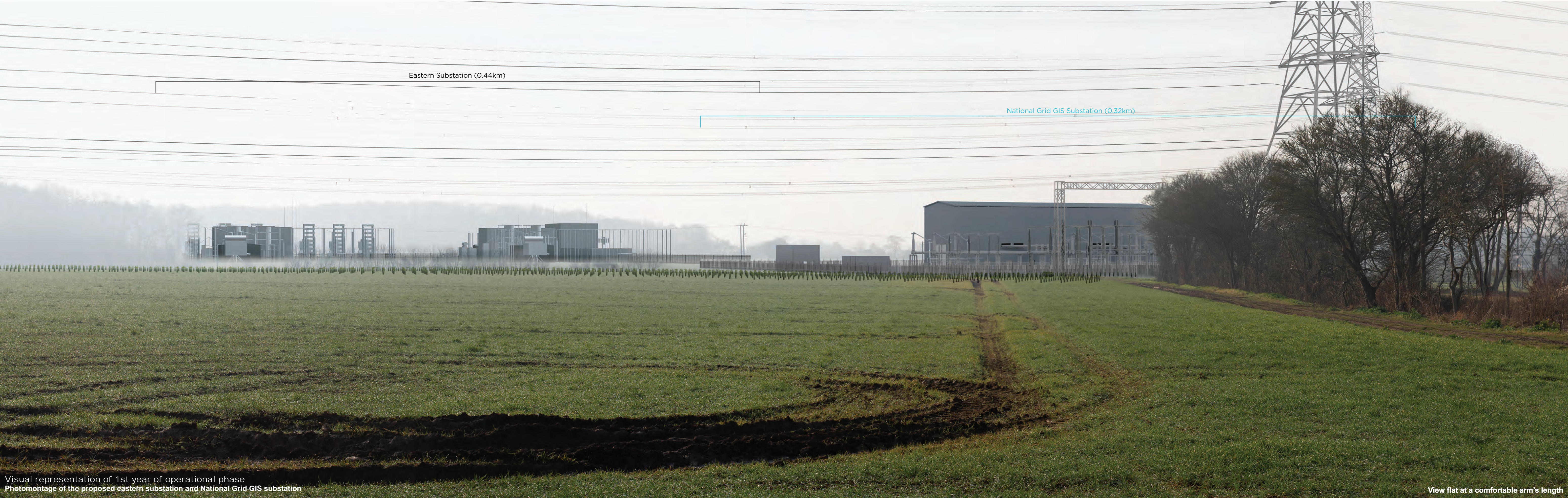
Visual representation of 1st year of operational phase Photomontage of the proposed eastern substation and National Grid GIS substation