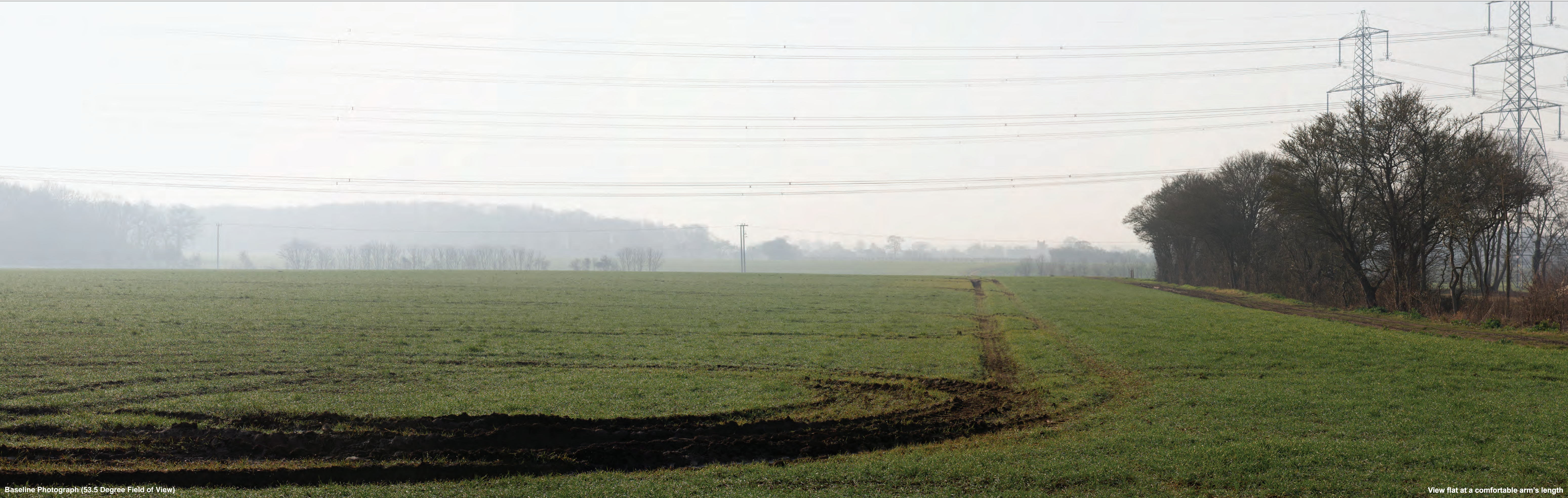
Baseline Photograph (53.5 Degree Field of View)