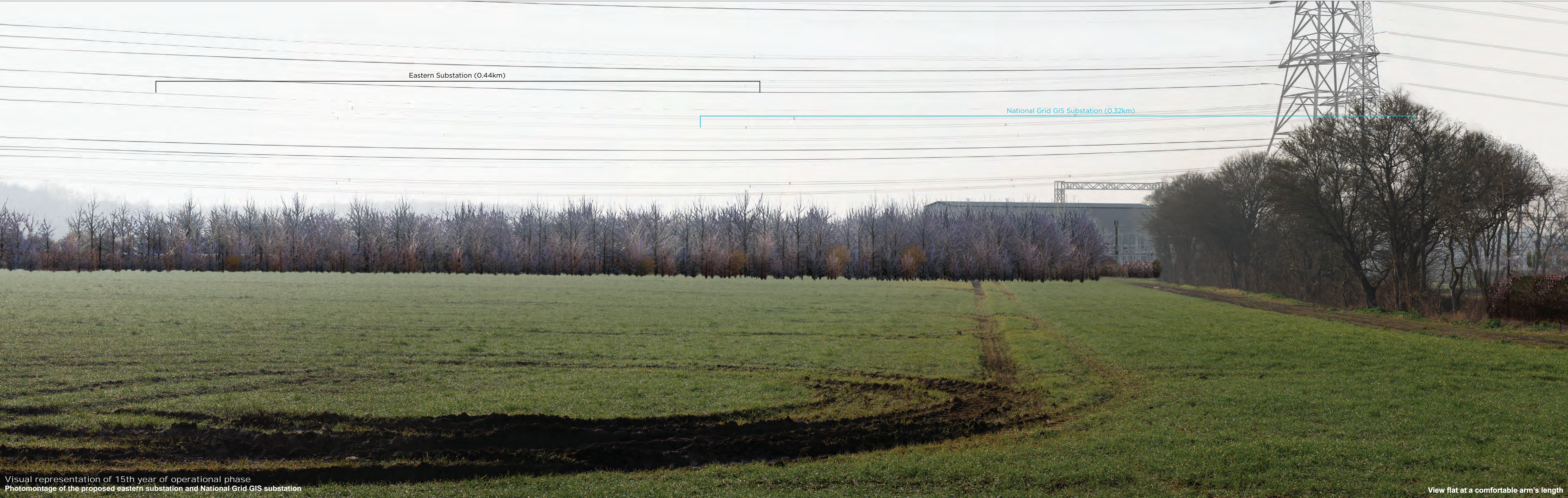
Visual representation of 15th year of operational phase Photomontage of the proposed eastern substation and National Grid GIS substation