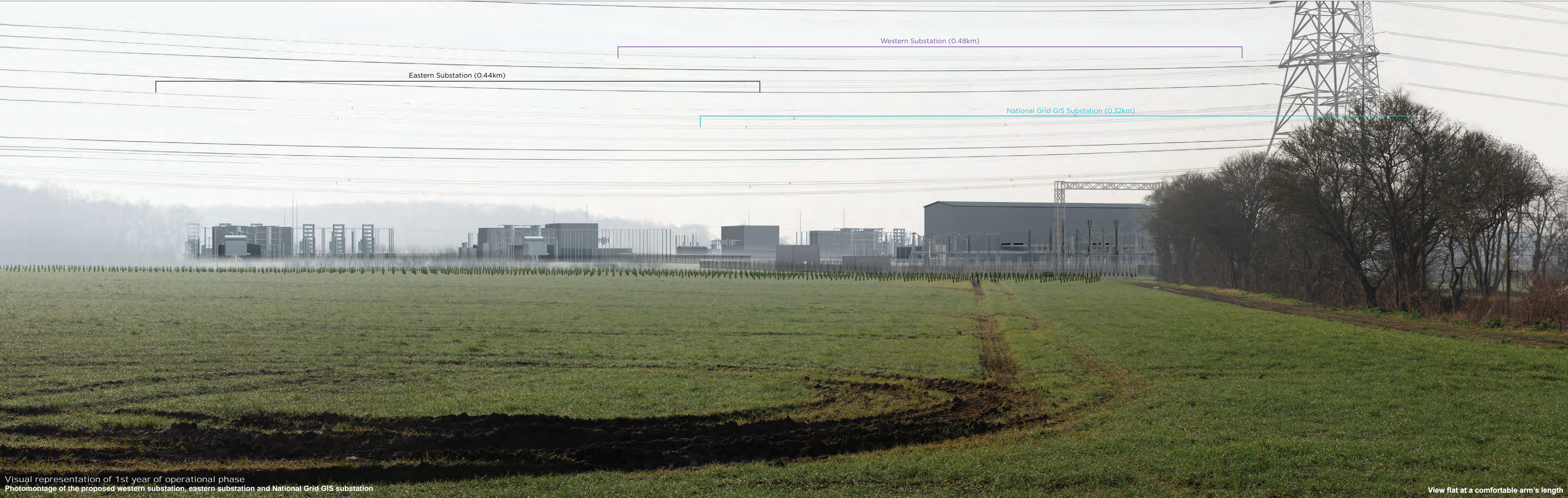
Visual representation of 1st year of operational phase Photomontage of the proposed western substation, eastern substation and National Grid GIS substation